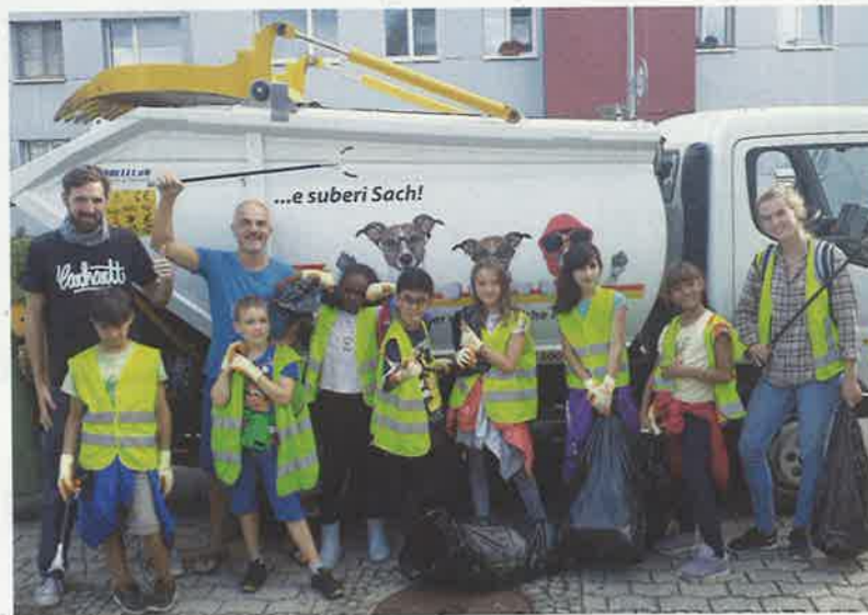
Die fleissigen Abfallsammler nach getaner Arbeit.